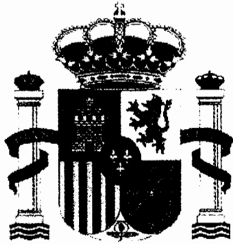
MINISTERIO DEL INTERIOR